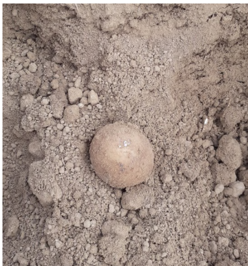
Fontane plantée le 24 avril—stade point blanc— Neuville St Vaast (62)