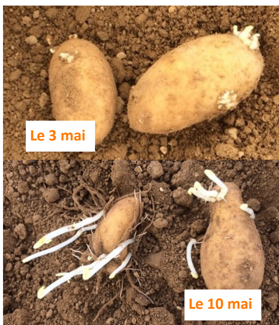
Gwenne plantée le 9 avril —secteur Estrées Mons