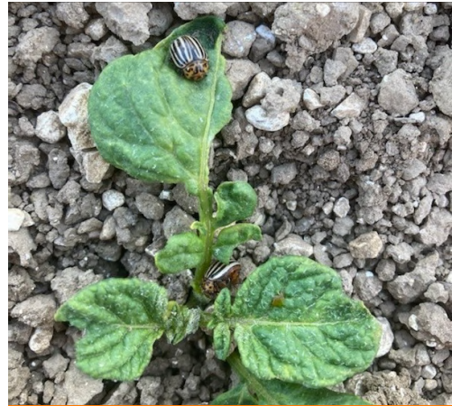
Doryphore adulte sur repousses — Secteur Saint Quentin (02)