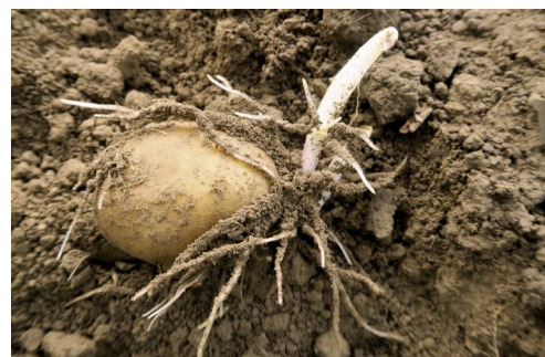
Variété Colomba plantée le 1er avril, germes 8 cm—Villers Pol (59)