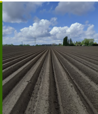
Fontane plantée le 23 avril—stade points blancs—Premesques (59).