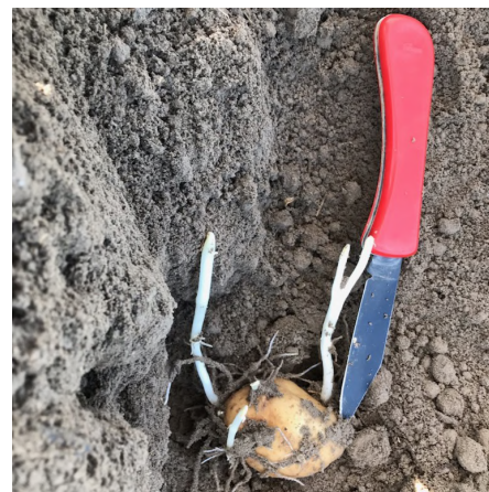
Shepody plantée le 7 avril