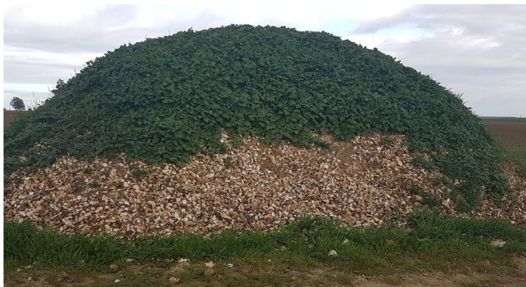
Tas de déchets non géré secteur Hangest en Santerre

Un tas qui présente des repousses à Hangest en Santerre (80).