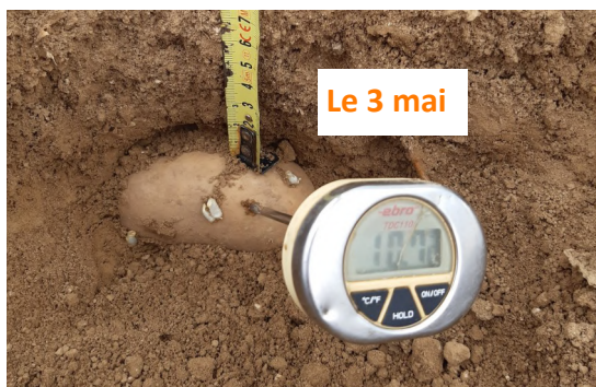
Amandine plantée le 8 avril (secteur Ham—80)