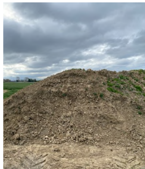
Tas de déchets non géré avec présence de quelques repousses à Bois Grenier (59)