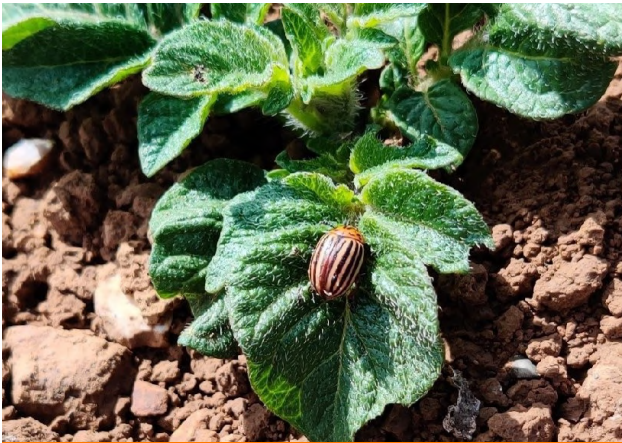
Doryphore adulte sur repousses en parcelle de maïs—Cottenchy (80)

Les conditions climatiques passées et prévisionnelles, associées au contexte sanitaire de l'année dernière, laissent présager une campagne riche en ravageurs !