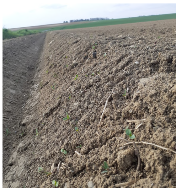
Salissement en parcelle