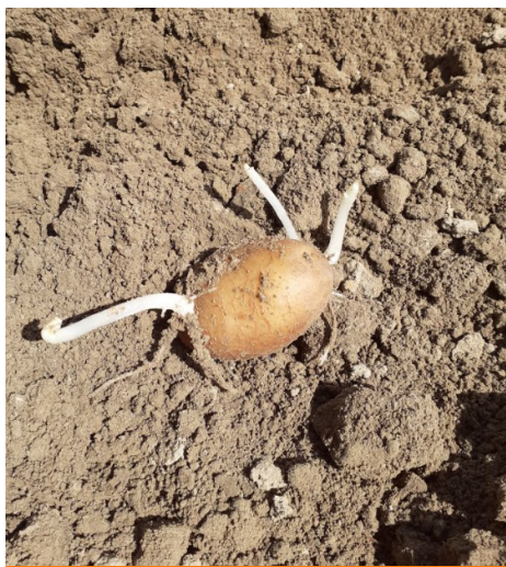
Fontane plantée le 8 avril—germes 5cm—Orchies (59)